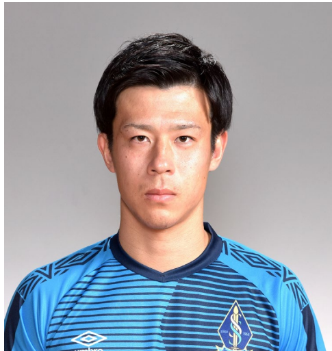
アシスタントコーチ